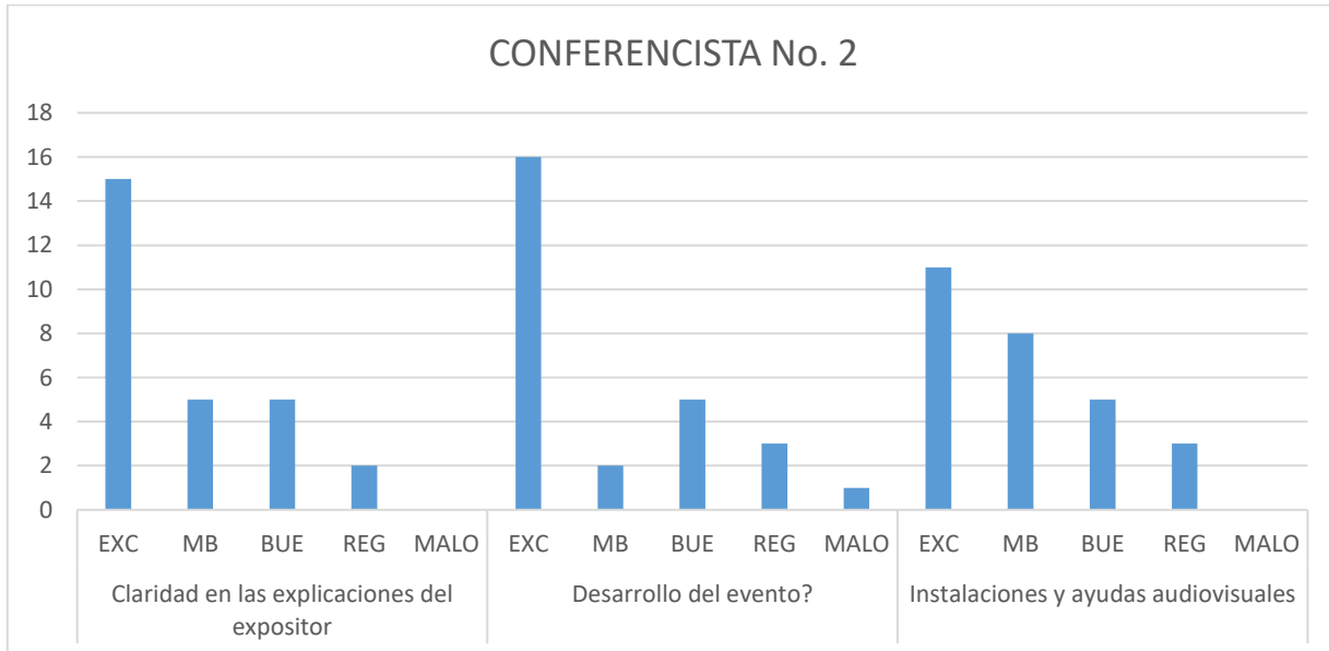
Gráfica No. 2 Calificación Total – LEONARDO LEÓN